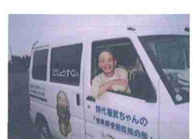
筑波山名物・ガマの油売り パナナの叩き売り 南京玉すだれ ハワイにて「どじょうすくい」初公演 「時代屋武ちゃんの安来節全国放浪の旅」の愛車

時代屋プロのホームページ： http://www.hct.zaq.ne.jp/epaka301/sub-1.htm